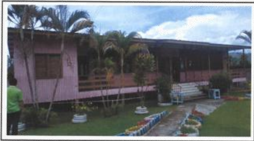
Bangunan bilik darjah