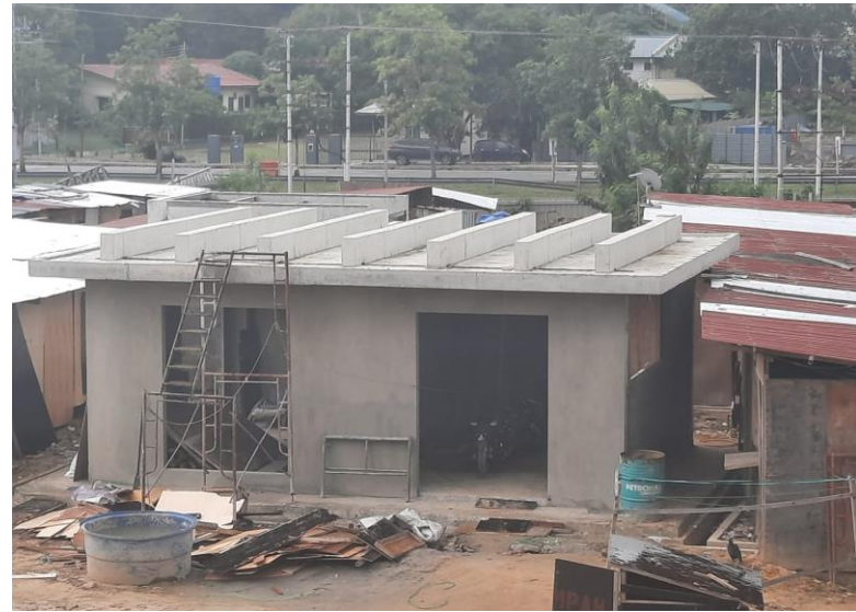
Bangunan Genset & Rumah Pam