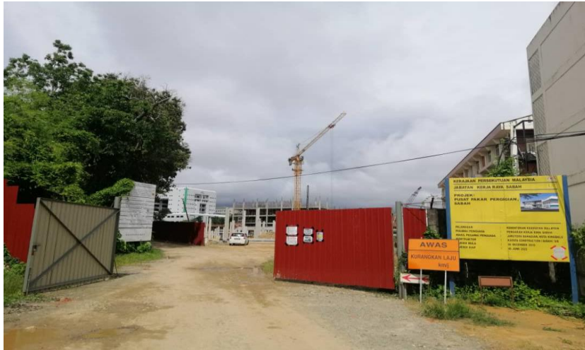
Jalan Masuk Ke Tapak Pembinaan