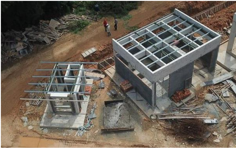
Bangunan Fire Common Centre & SESB