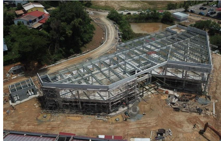
Bangunan Utama (2-Tingkat)